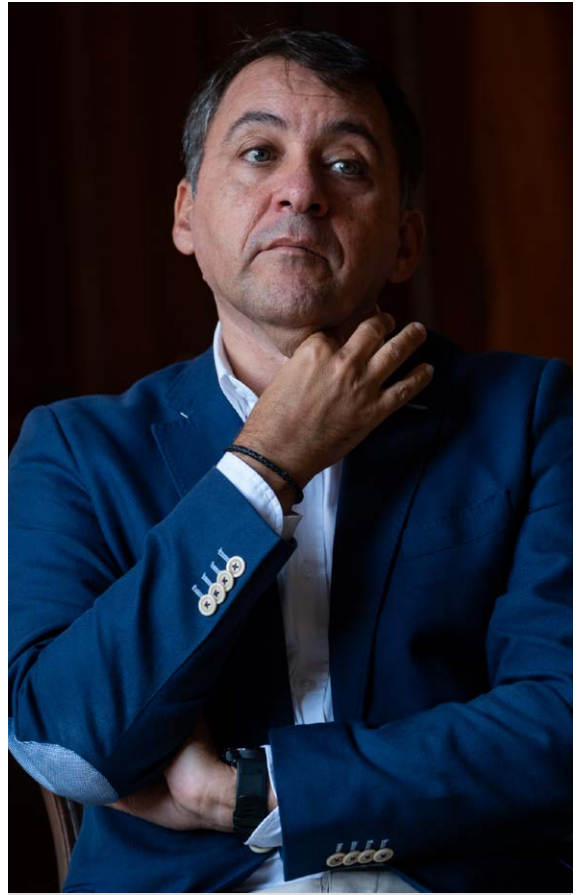
José Manuel Bermúdez, alcalde de Santa Cruz de Tenerife